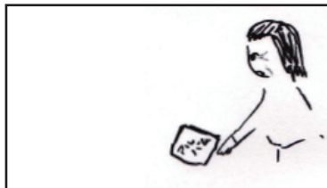
アルバムを見つける母