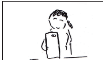
回想 下宿先でスマホいじる A 子