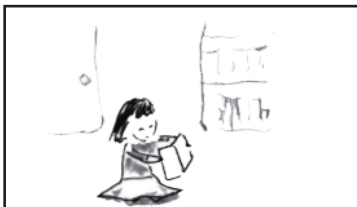
アルバムを読む A 子