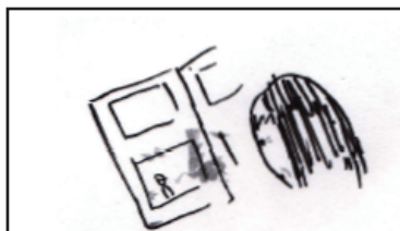
濡れたページを 見つめる母