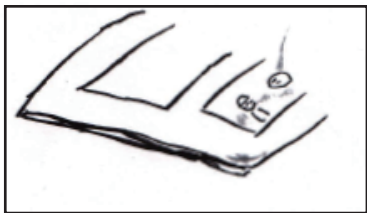
涙がアルバムに落ちる