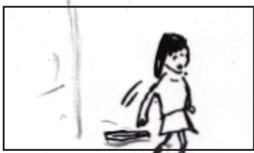
母に呼ばれ、出て行く