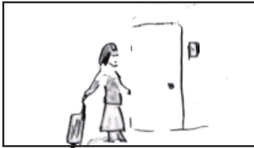
実家に戻る A 子