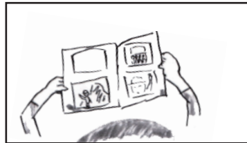
アルバムをめくる手元ヨリ