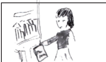
本棚のアルバムを取り出す