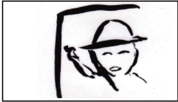
満面の笑顔の写真

〈A子NA〉 いちばん手垢のついた そのページの写真は 私が最高の笑顔をした写真だった