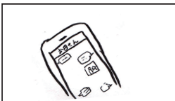
スマホ画面 母とのやりとり